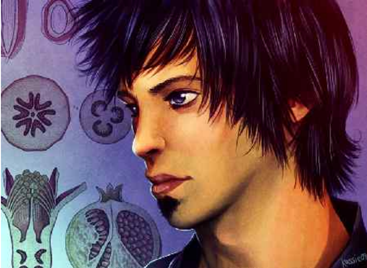
Punica Granatum

L'expression neuvième art qui désigne la bande dessinée est due à Morris (pseudonyme de Maurice de Bévère et créateur de Lucky Luke) et Pierre Vankeer qui animèrent, trois ans durant au sein du Journal de Spirou (du numéro 1392 au numéro 1523) une rubrique intitulée Neuvième Art, sous-titrée Musée de la bande dessinée, qui faisait le tour de la bande dessinée internationale et de son histoire.