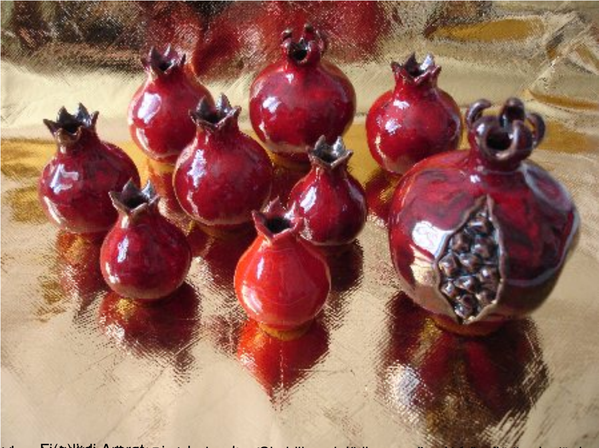
The Fi(g)li di Ararat by John Singer Sargent, oil on canvas, 1892, Los Angeles