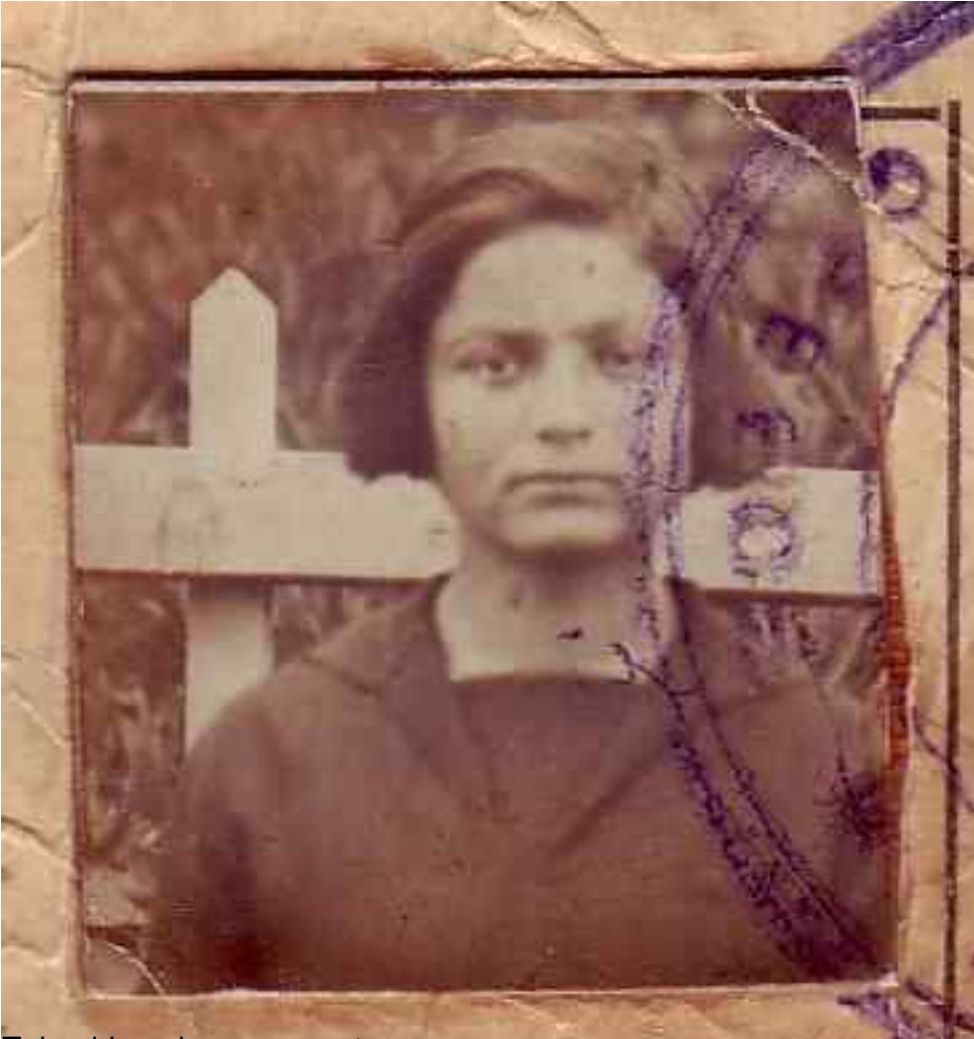
Foto di una donna armena di Antiochia, la città turca di 4 milioni di abitanti, nel 1900. La donna è di un'età avanzata e ha un'espressione triste.