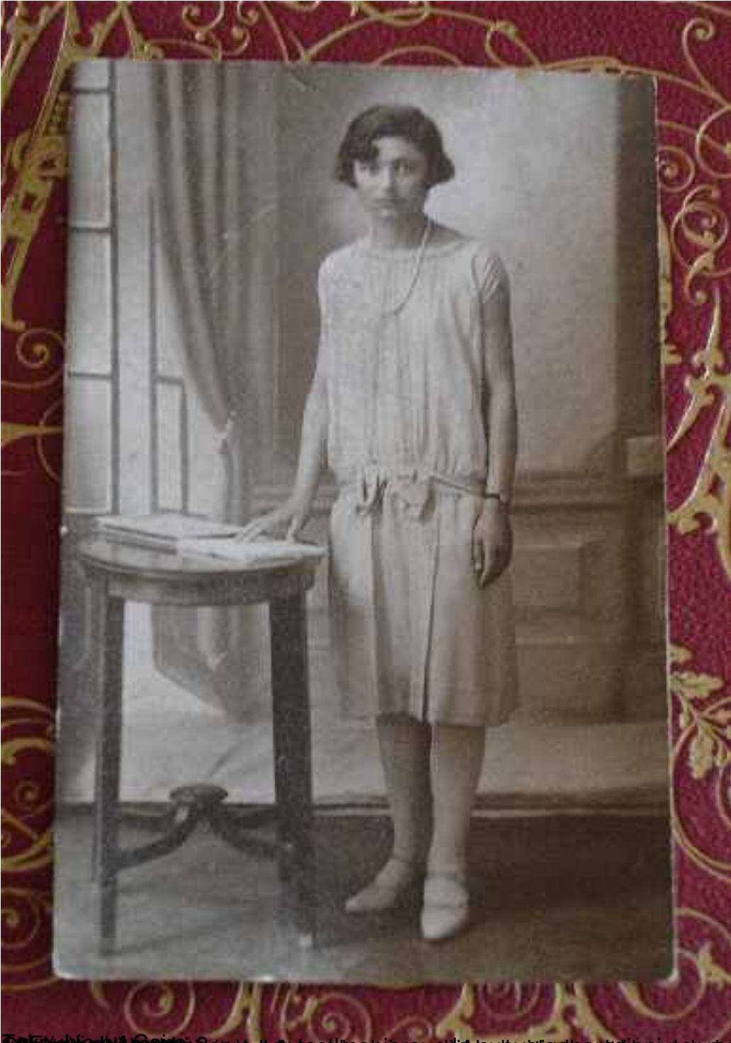
Le foto di una giovane donna armena che ha studiato in una scuola di una città americana, circa il 1910. La foto è stata scattata da un fotografo americano, e la donna è stata fotografata in una scuola di una città americana. La foto è stata scattata da un fotografo americano, e la donna è stata fotografata in una scuola di una città americana.