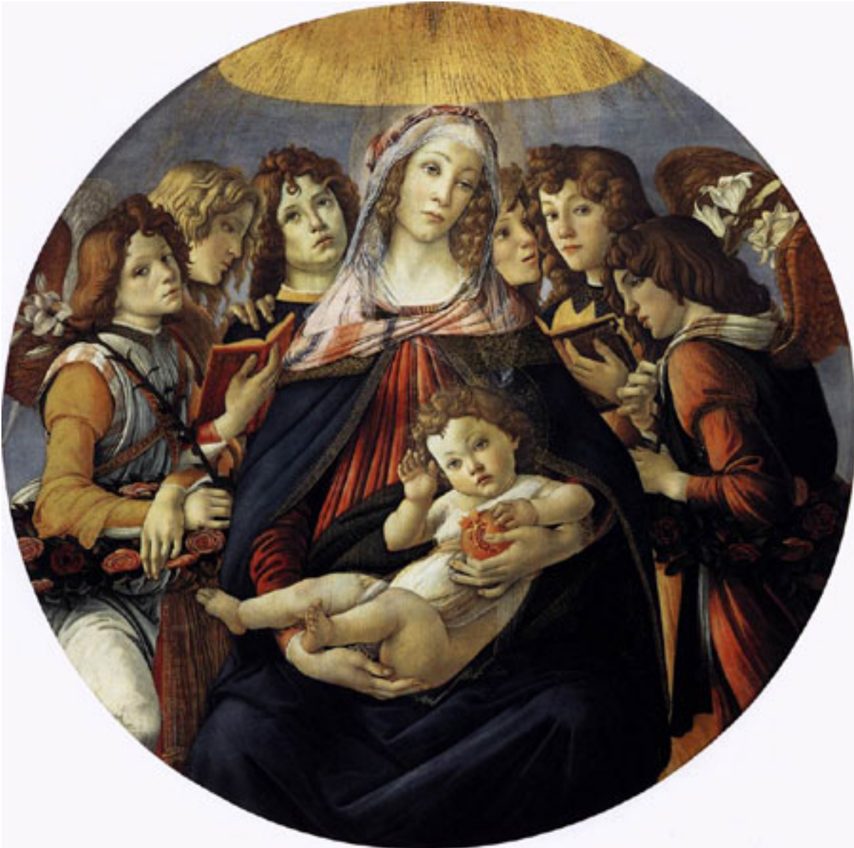
Madone à la grenade by Andrea Botticelli Madonna del melograno

La peinture est le 3e art défini par Hegel, dans son Esthétique vers 1818-1829.