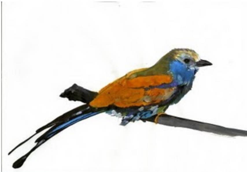
Ciro DLMATTEO (Napoli, Italy)