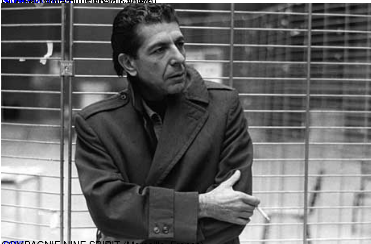
COM PAGNIE NINE SPIRIT (Marseille, France)