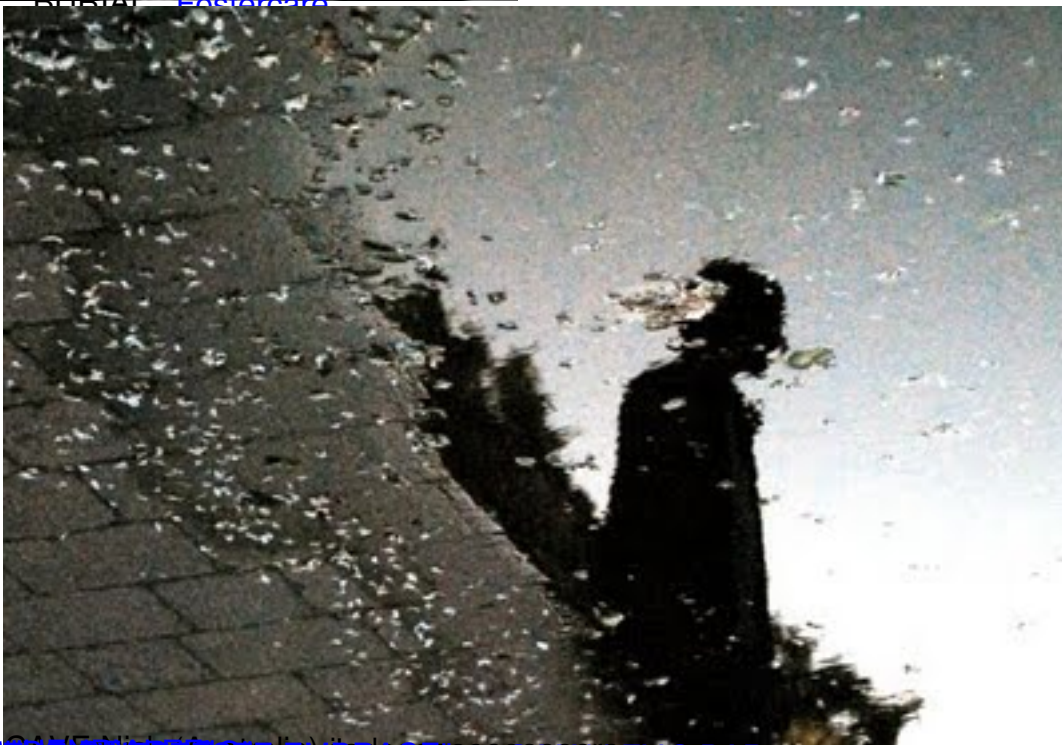
SOMEWHERE IN THE BRASS ON MALEY'S BAR